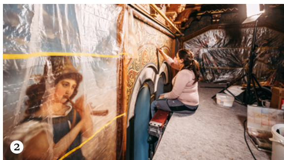
Kasteel Neuschwanstein 2.329 objecten en 93 kamers – met 184 muur- en plafondbevestigingen, 65 schilderijen en 355 meubelstukken – moesten worden hersteld voordat het kasteel een Werelderfgoedlocatie werd